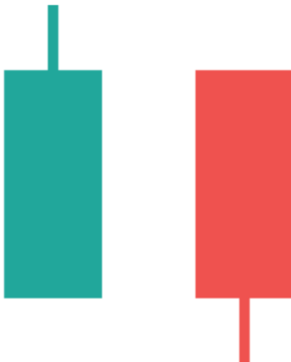
Shaved Bottom (No Lower Wick)

بسته به اینکه کدام انتها فاقد سایه است، برای هر نوع کندل صاف شده، نامی وجود دارد.